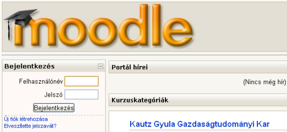
1. ábra A Moodle nyitólapjának részlete

Ahhoz, hogy a tananyagokat meg tudja nézni, Önnek be kell lépnie a Moodle-rendszerbe. A rendszer a moodle.sze.hu oldalon érhető el. Az oldal megnyitása után az alábbi képernyővel találkozik: