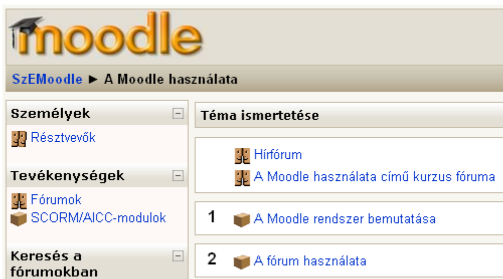
5. ábra A Moodle használata című kurzus leckéi

Kattintás után a kurzus leckéinek listáját látja (5. ábra)