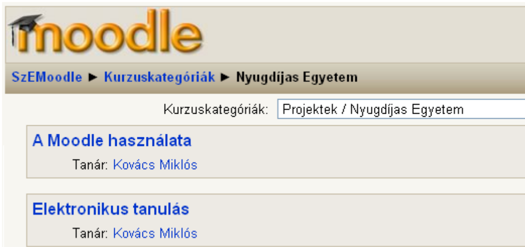
3. ábra A Nyugdíjas Egyetem Kurzusai

Kattintson „A Moodle használata” című kurzus nevére a belépéshez. Amikor Ön először lép be a kurzusba, akkor rendszer rákérdez arra, hogy szeretne-e a kurzus hallgatói közé feliratkozni. Kattintson az „Igen” gombra (4. ábra)!