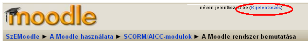
8. ábra A „Kijelentkezés” felirat a jobb felső sarokban

A leckék megtekintése után a Moodle ablakának vagy a jobb felső (8. ábra), vagy bal alsó (9. ábra) sarkában találja a „Kijelentkezés” feliratot. Ezek valamelyikére kattintva tud kilépni a rendszerből.