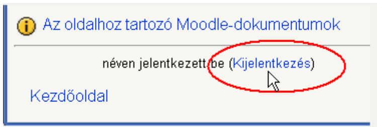
9. ábra A „Kijelentkezés” felirat a bal alsó sarokban