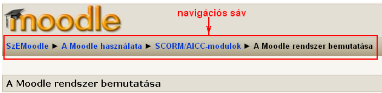
7. ábra A navigációs sáv

A leckéből az úgynevezett navigációs sáv segítségével tud kilépni. A navigációs sáv a „Moodle” felirat alatt található (a 7. ábrán piros téglalappal kereteltük be.) A sávról megállapítható, hogy a rendszeren belül Ön éppen melyik kurzusban melyik tananyagot nézi.